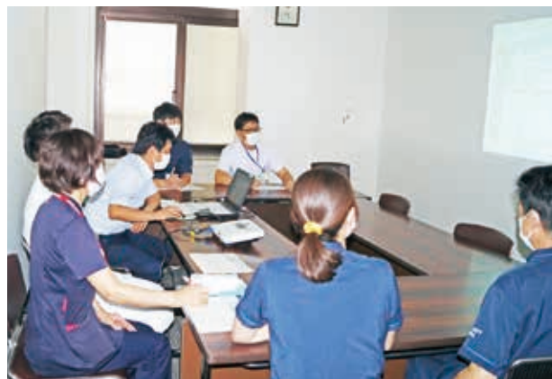
▲医師、看護師、薬剤師、検査技師、事務で事例検討を行っている様子

流行性疾患の罹患状況の把握と感染対策指導を行っています。また、インフルエンザや麻疹等の流行性ウイルス疾患のワクチン接種を行い、流行性疾患の罹患防止にも努めています。