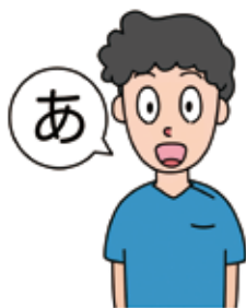
「あ～」と口を大きく開ける