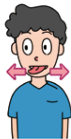
舌を左右に動かす