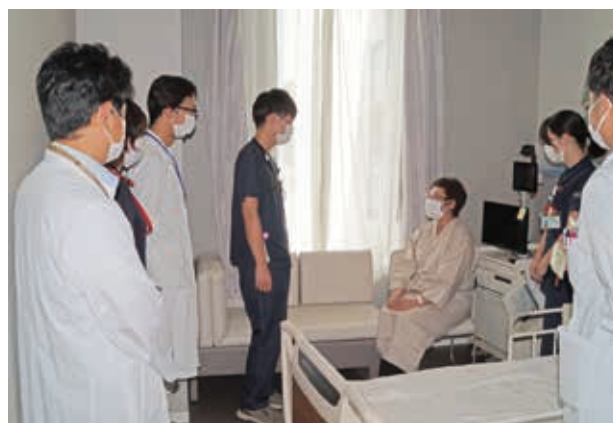
▲患者さんの診察の様子 (抗菌薬の使用状況の確認、適正化のため)