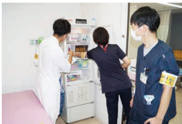
▲院内ラウンドの様子 (衛生的な環境や感染対策遵守の確認)