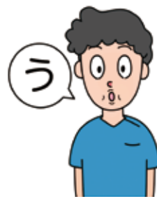
「う～」と口をとがらせる