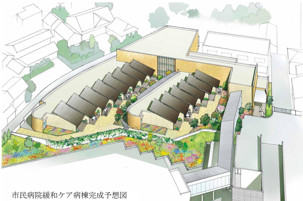
市民病院緩和ケア病棟完成予想図